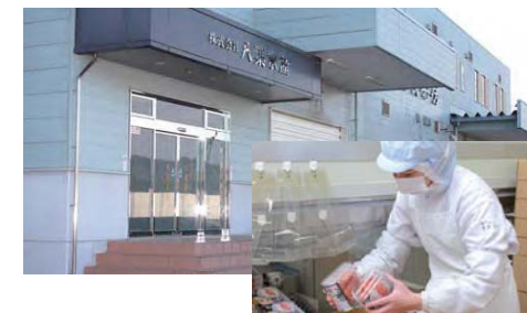
水産加工施設 (宮城県気仙沼市)