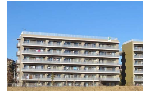
災害公営住宅 (宮城県石巻市)