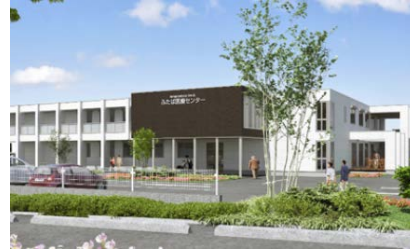
医療環境の整備 (福島県ふたば医療センター附属病院) (富岡町)