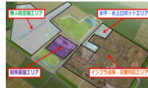
福島ロボットテストフィールド (南相馬市、浪江町)