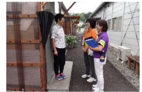
生活支援相談員による見守り活動