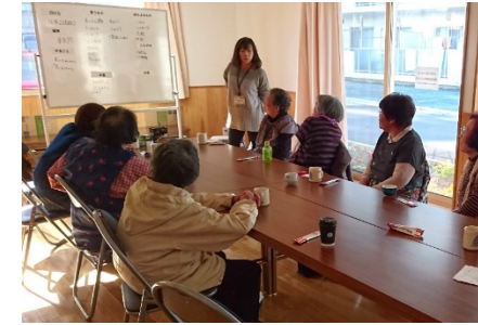
移転先での新たなコミュニティ形成に向けて

→見守り・生活相談、心身のケア、コミュニティ形成支援など、生活再建のステージに応じた切れ目ない支援を実施