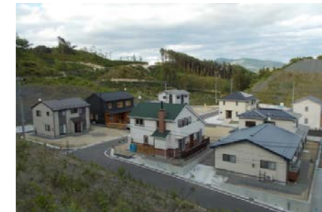
高台移転 (岩手県宮古市)