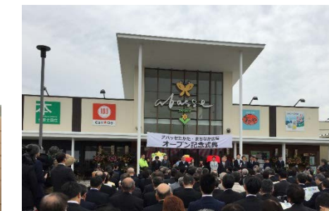
アバッセたかた (岩手県陸前高田市)