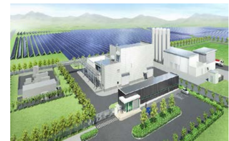
エネルギー関連産業の創出 (再エネ由来大規模水素製造実証拠点) (浪江町)